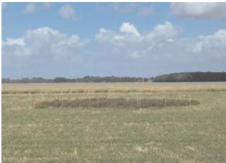
Nestbescherming grauwe kiekendief