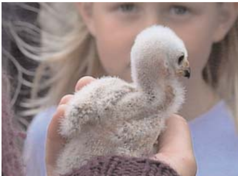
Jonge grauwe kiekendief, bewonderd door de volgende generatie