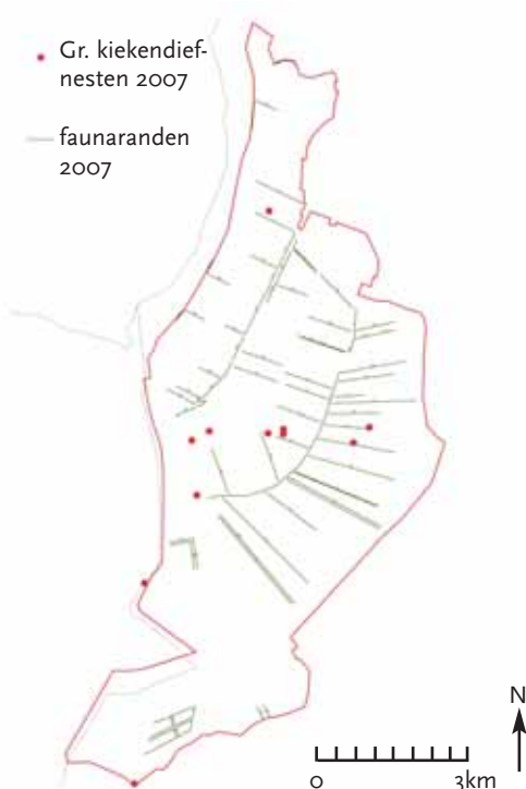
Fig. 2. Faunaranden en de verspreiding van nesten Grauwe kiekendief in Rheiderland (Duitsland) in 2007.