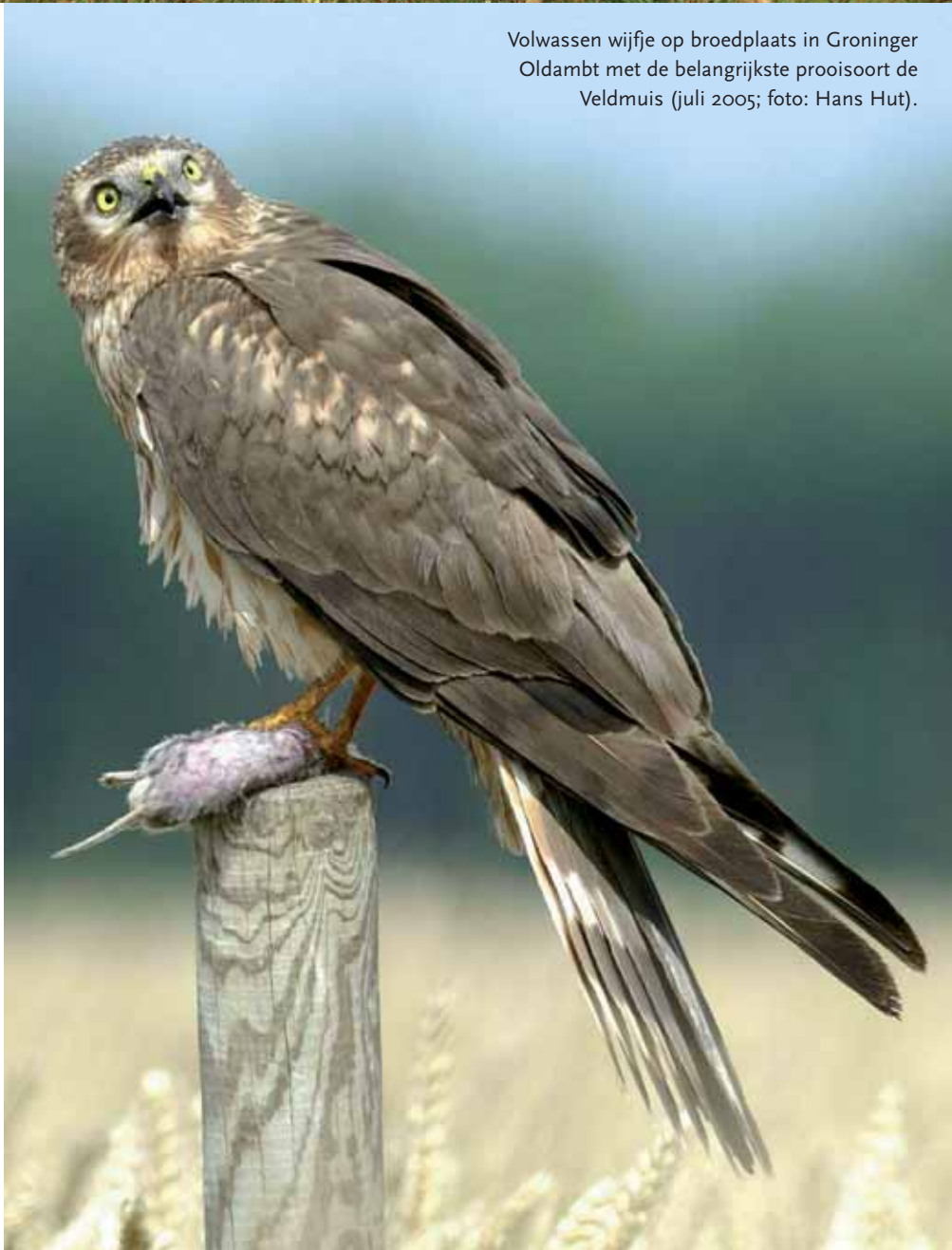
Volwassen wijfe op broedplaats in Groninger Oldambt met de belangrijkste prooisoot de Veldmuis (juli 2005).

Het 'Groninger model' in het grensgebied In 2002 streek de WGK neer in het Duitse Nedersaksen. Uitstapjes in de jaren daarvoor hadden al duidelijk gemaakt dat de schattingen van het aantal broedende Grauwe kiekendieven in Duitsland te laag waren en dat er jaarlijks 50-60% van de legfels in met name wintergerst en koolzaad stelselmatig door oogstwerkzaamheden mislukten. Tijd om een begin te maken met een grondiger aanpak van het beschermingswerk. Inmiddels zijn we een paar jaar verder en blijkt dat er geen dertig paar Grauwe kiekendieven broeden, maar tussen de 100 en 140. Van een behoorlijk deel van deze paren worden de nesten nu tijdig gevonden en beschermd.