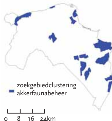
Fig. 3. Binnen deze zoekgebieden worden de Groninger faunaranden geconcentreerd.