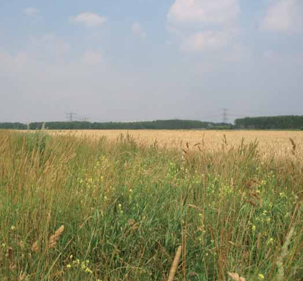
Goed gedimensioneerde faunarand in Polder Hoop op Beter nabij Veendam (juni 2006).